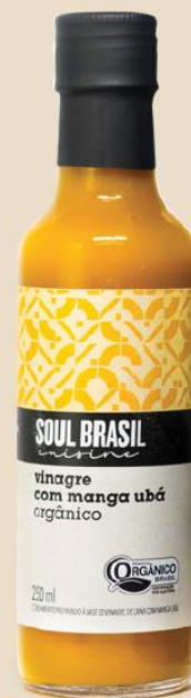
Ubá Mango Eddik Tilbehør - Økologisk Inneholder: 250 ml