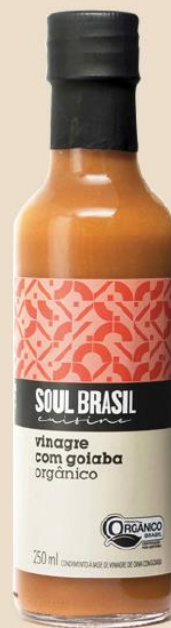
Guava Eddik Tilbehør - Økologisk Inneholder: 250 ml