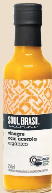
Acerola Eddik Tilbehør - Økologisk Inneholder: 250 ml