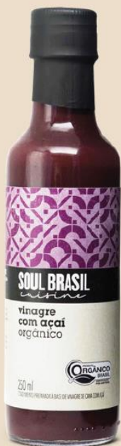
Açaí Eddik Tilbehør - Økologisk Inneholder: 250 ml